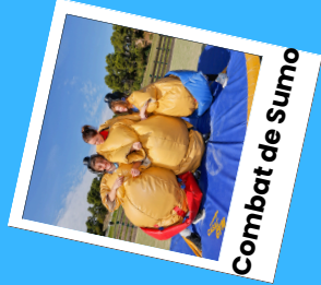
Combat de Sumo