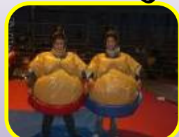
Combat de sumos

DU SPORT, DES JEUX ET DE L'ANIMATION A PART ÉGALE POUR LES MOYENS