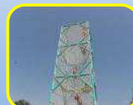
Tour de grimpe