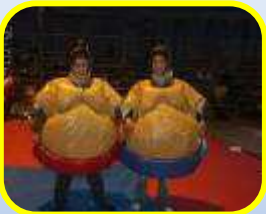
Combat de sumos